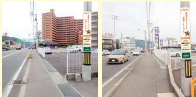
愛媛マラソンのコース沿いにある電柱に掲出されます。 (掲出場所一例:写真は掲出イメージです。)