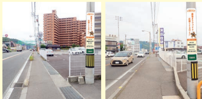
愛媛マラソンのコース沿いにある電柱に掲出されます。 (掲出場所一例:写真は掲出イメージです。)

愛媛マラソンのランナーを「電柱広告」で応援しませんか？ 会社のイメージアップにつながり、地元貢献にも役立ちます。 マラソンコース沿道の約200本の電柱から選べます。 ぜひご賛同ください！