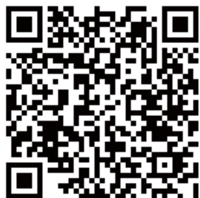
携帯電話用QRコード